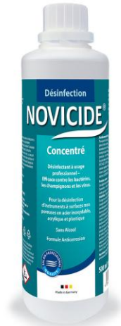
DESINFECTANT A DILUER CONCENTRE