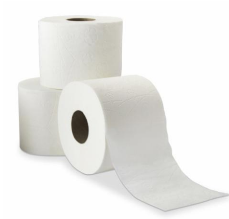
PAPIER TOILETTE DOMESTIQUE PURE CELLULOSE 2 PLIS – 9,5 x 10 cm