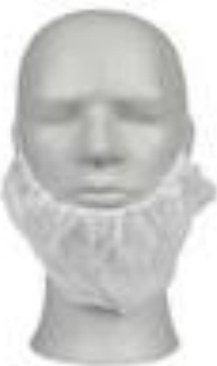
CACHE BARBE NON TISSE – BLANC