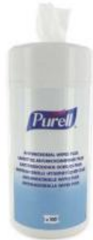
LINGETTES DESINFECTANTES LA BOITE DE 100 LINGETTES