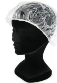
CHARLOTTES PLASTIQUES TRANPARENTE EMBALLAGE INDIVIDUEL