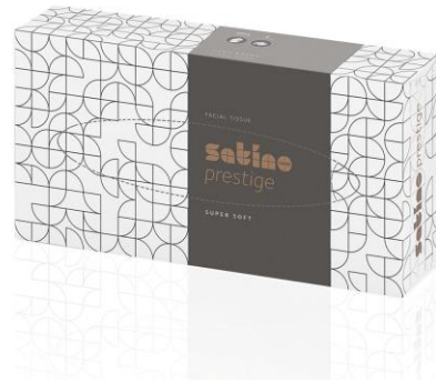
MOUCHOIRS EN PAPIER