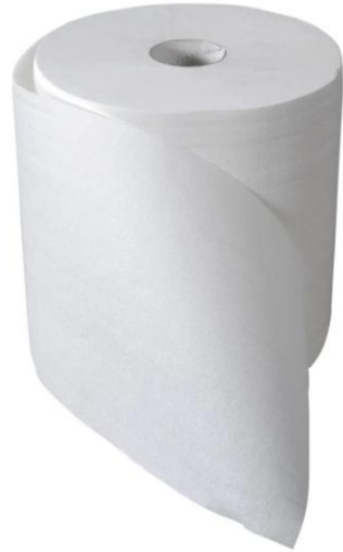
ESSUIE MAINS CONTINU PURE CELLULOSE – 19,8 x 39 cm