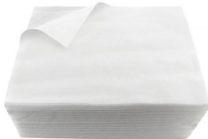
SERVIETTES JETABLES TNT GAUFREE 30 x 40cm