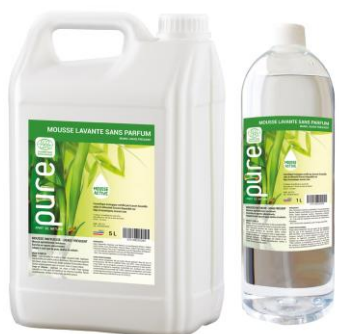
MOUSSE LAVANTE SANS PARFUM

Le jerrican 5L | PURENEUTRAL5 1L | PURENEUTRAL1P