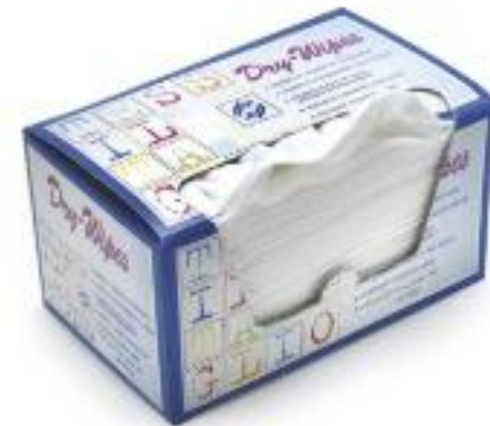
LINGETTES MULTI-USAGES – TISSU NON TISSE 30 x 20cm