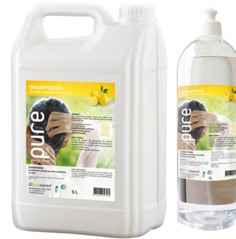
SHAMPOING DOUX PARFUME AUX HUILES ESSENTIELLES DE CITRUS

Le jerrican 5L | PUREDOUCHE5 1L | PUREDOUCHE1