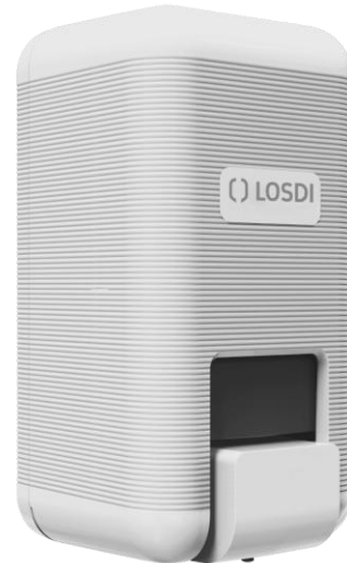
DISTRIBUTEUR SAVON MATIERE ABS – 900 ml