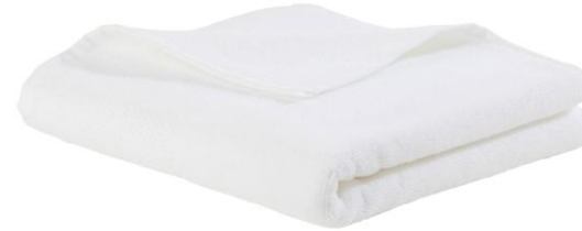
SERVIETTES DE BAIN Non tissé 100% coton biodégradable