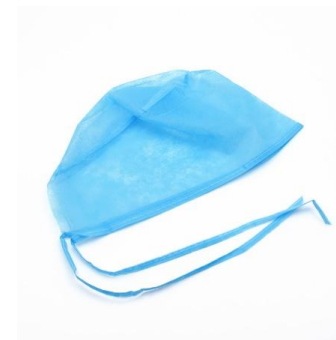
CALOT A LACETS – BLEU / BLANC

Calot à élastiques bleu Le pack de 100 | A202 Calot à élastiques blanc Le pack de 100 | A201