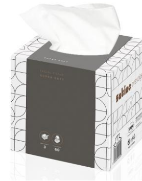
MOUCHOIRS EN PAPIER