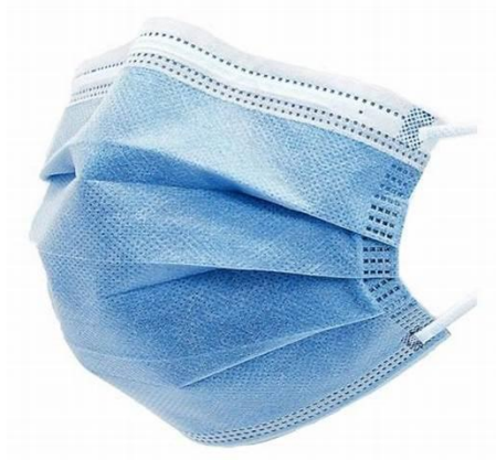
MASQUE CHIRURGICAL A ELASTIQUES - BLEU BOITE DE 50 MASQUES