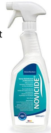
SPRAY DESINFECTANT SANS PARFUM