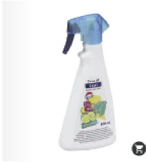
NETTOYANT SKAI SURODORANT & ANTISTATIQUE