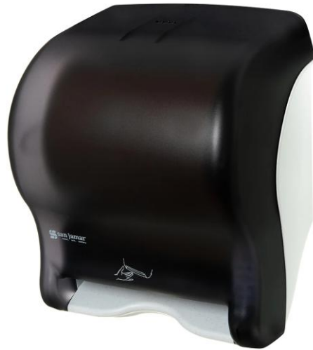
DISTRIBUTEUR DE PAPIER ELECTRIQUE 30 x 36,6 x 23,3