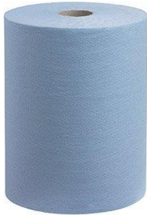
BOBINES D'ESSUYAGE INDUSTRIELLES – BLEUES OUATE RECYCLEE – 1000 FEUILLES 19,8 x 22 cm