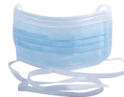
MASQUE CHIRURGICAL A LACETS - BLEU BOITE DE 50 MASQUES