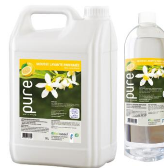
MOUSSE LAVANTE PARFUMEE AU CITRON

Le jerrican 5L | PURENEUTRALMOUSS 1L | PURENEUTRALMOUSS1