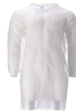
BLOUSE VISITEUR A SCRATCH – BLANCHE