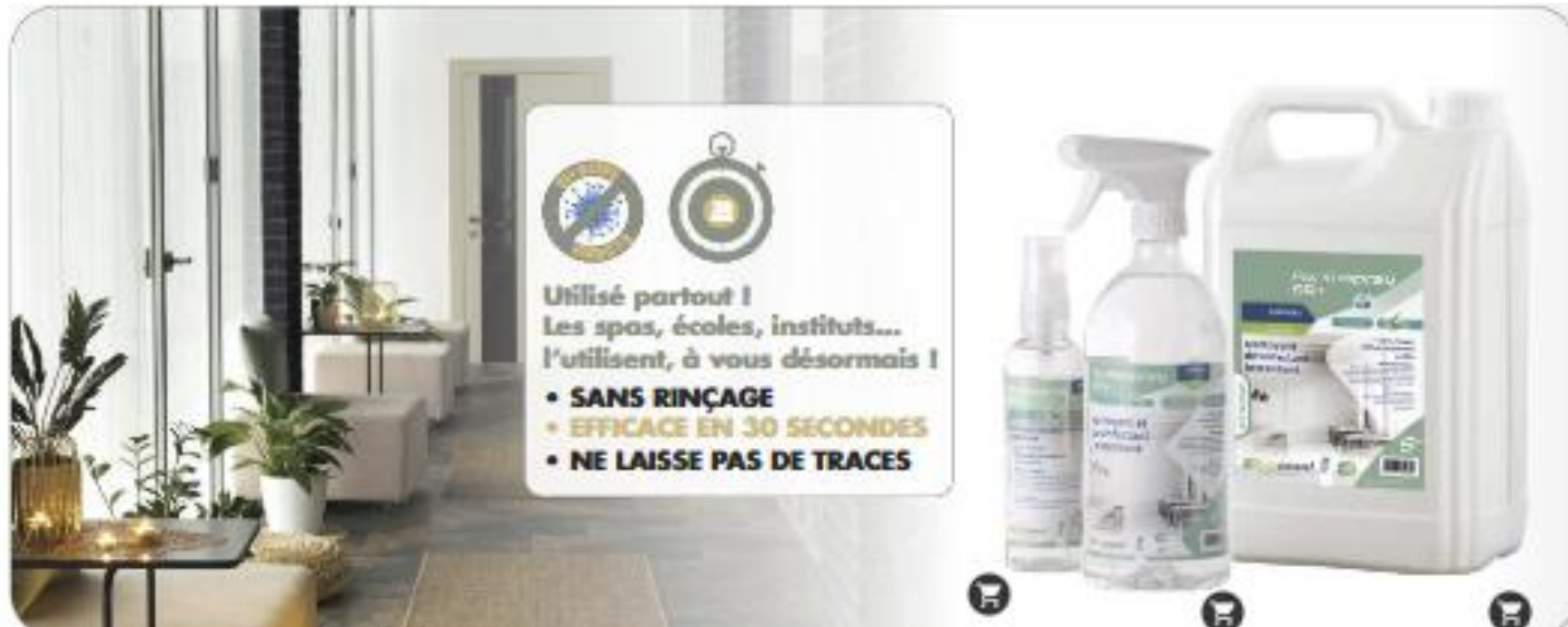
DESINFECTANT VIRUCIDE PENTASPRAY SR +