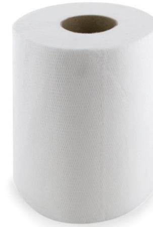
BOBINES D'ESSUYAGE INDUSTRIELLES - BLANCHES PURE CELLULOSE – 1000 FEUILLES 19,6 x 30 cm