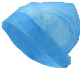
CALOT A ELASTIQUES – BLEU / BLANC

Calot à élastiques bleu Le pack de 100 | A202 Calot à élastiques blanc Le pack de 100 | A201