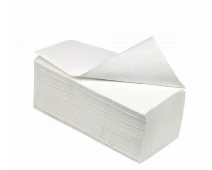
ESSUIE MAINS 2 PLIS x200 FORMATS 21 x 24cm