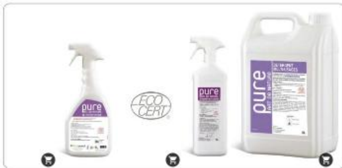
NETTOYANT VITRES PRÊT A L'EMPLOI