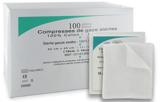
COMPRESSES DE GAZE STERILES 40 x 40cm DEPLIEES – EMBALLAGE INDIVIDUEL