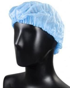
CHARLOTTES TISSU NON TISSE - BLEUES VRAC