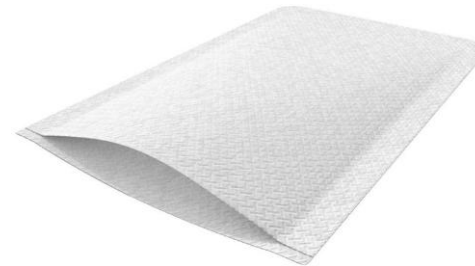
GANTS DE TOILETTES JETABLES