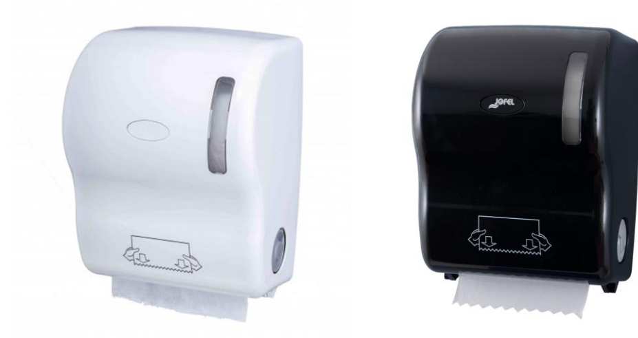
DISTRIBUTEUR DE PAPIER MANUEL 28,5 x 36 x 23,5 cm