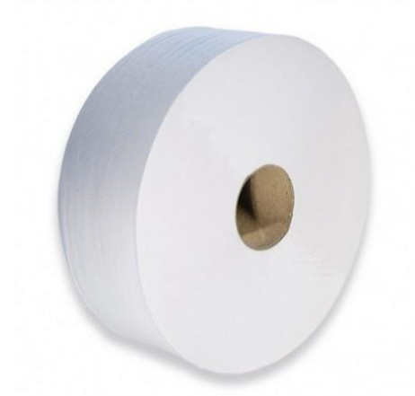
PAPIER TOILETTE MAXIROL PURE CELLULOSE 2 PLIS – 8,3 x 25 cm