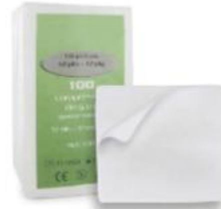
COMPRESSES DE GAZE 30 x 40cm DEPLIEES