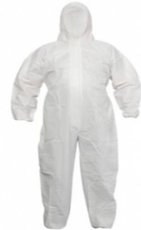
COMBINAISON A CAPUCHE NON TISSE – BLANCHE