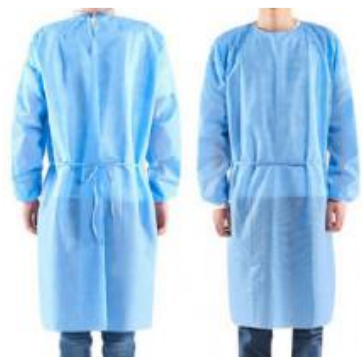
BLOUSE VISITEUR A LACETS – BLEU & BLANC

Blouse visiteur blanche L'unité | M2207 Blouse visiteur bleue L'unité | M2205