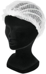
CHARLOTTES TISSU NON TISSE - BLANCHES VRAC