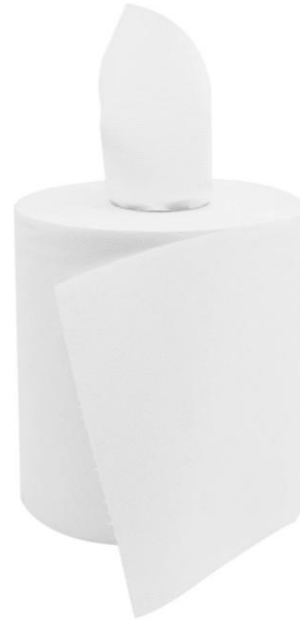
ROULEAUX DEVIDAVE CENTRAL PURE CELLULOSE – 450 FEUILLES 18,2 x 25 cm