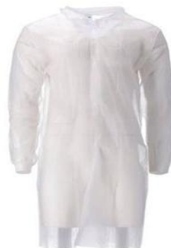
BLOUSE VISITEUR A BOUTONS – BLANCHE

Blouse visiteur blanche L'unité | M2207 Blouse visiteur bleue L'unité | M2205