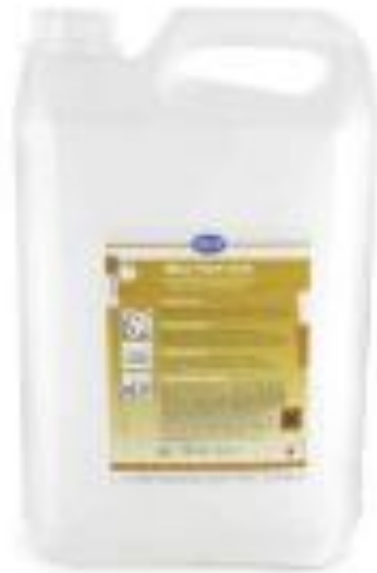
DETERGENT DESINFECTANT A DILUER CONCENTRE