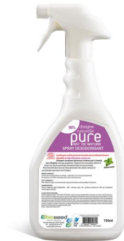
SPRAY DESODORISANT PRÊT A L'EMPLOI