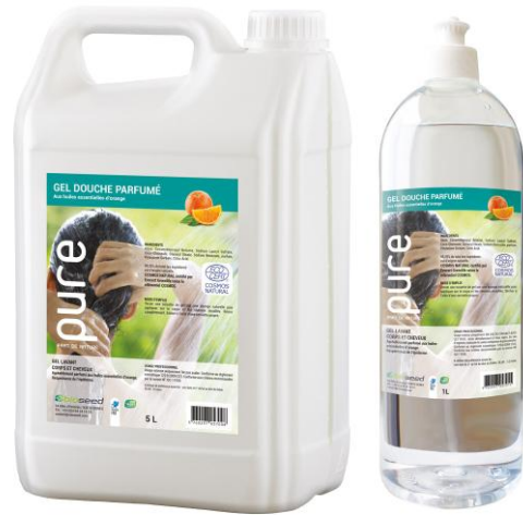
GEL DOUCHE PARFUME A L'ORANGE

Le jerrican 5L | PUREDOUCHE5 1L | PUREDOUCHE1