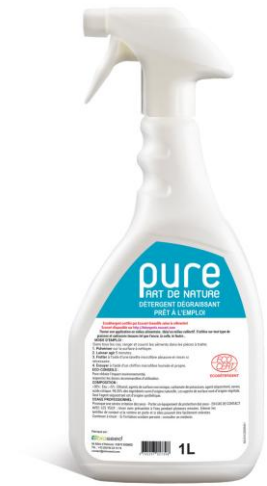
PURE DETERGENT DEGRAISSANT INOX ET METAL ULTRA POLYVALENT ET ECOLOGIQUE