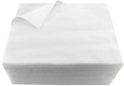
SERVIETTES JETABLES TNT QUALITE SOFT 30 x 40cm