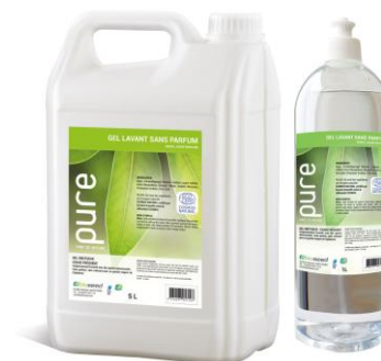
GEL LAVANT SANS PARFUM

Le jerrican 5L | PURENEUTRAL5 1L | PURENEUTRAL1P