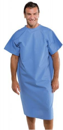
BLOUSE PATIENT ADULTE – BLEU