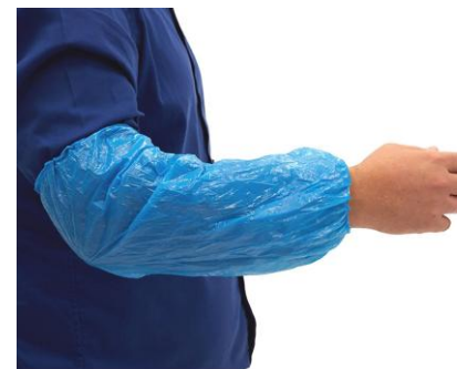
MANCHETTES POLYETHYLENE – BLEUE