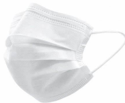
MASQUE CHIRURGICAL A ELASTIQUES - BLANC BOITE DE 50 MASQUES