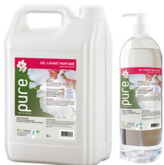
GEL LAVANT PARFUME AUX FLEURS BLANCHES

Le jerrican 5L | PUREMAINS5 1L | PUREMAINS1P