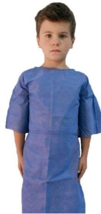
BLOUSE PATIENT ENFANT – BLEU